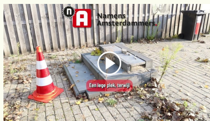
Grote wachtlijst voor woonwagenveld, toch ruim een jaar leegstand: hoe dan?! 37.000 views