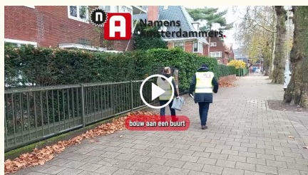
Verbouwingen en sociale samenhang in de Apollo- en Minervabuurt 40.000 views

Van onze ruim 80 video's springen 4 video's eruit. U kunt ze zien als symbool voor de kloof tussen politiek en burger. Want deze onderwerpen zijn weinig prominent in het politieke debat. Maar de cijfers ( 131.000 views totaal ) laten zien dat ze leven en belangrijk gevonden worden. Noot: genoemde cijfers zijn vanuit al onze social mediakanalen opgeteld.